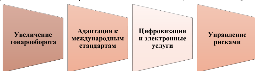
Рисунок 1. Основные направления влияния глобализации на таможенную систему.