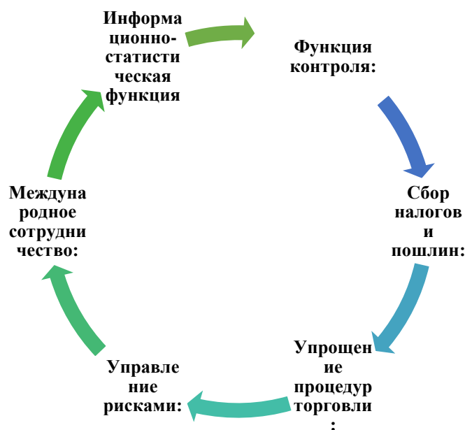
Рисунок 4. Функции таможенной системы.